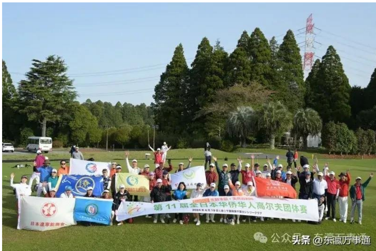
2024年4月19日“第10届全日本华侨华人高尔夫杯赛”