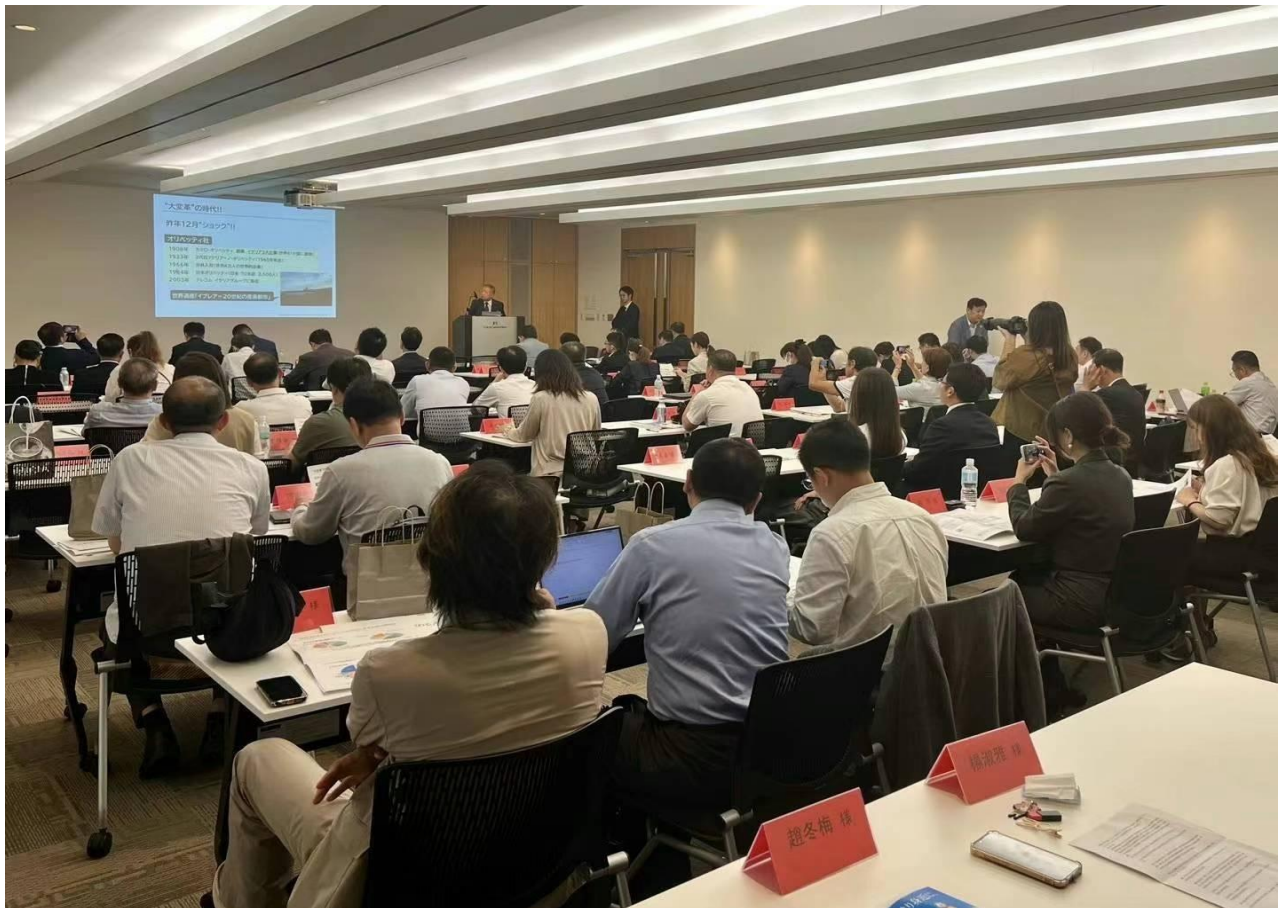
2024年9月24日“第二届国际M&A高峰论坛”