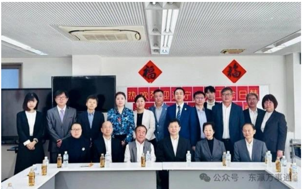
2024年11月1日“辽宁省总工会日韩访问团交流座谈会”