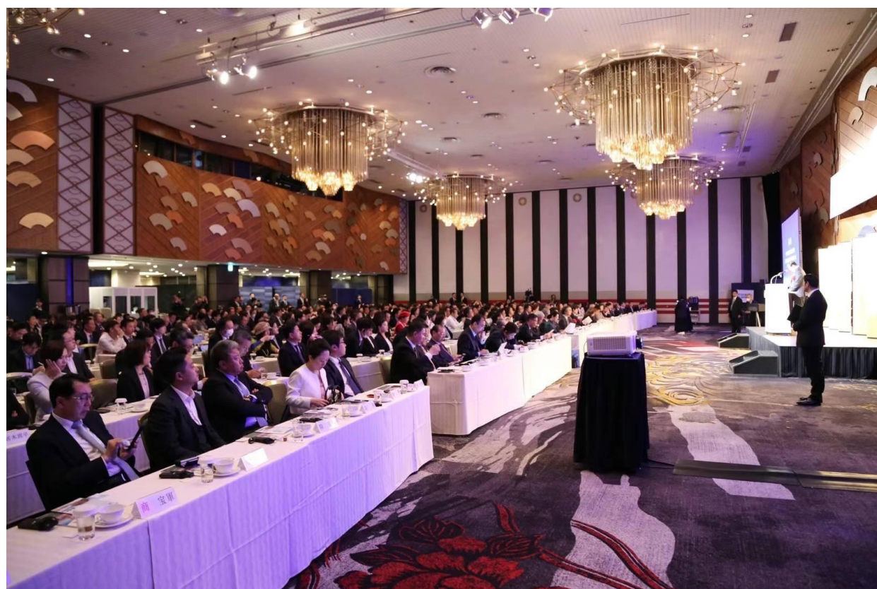
2024年4月19日“辽宁-日本经济贸易协力交流说明会”