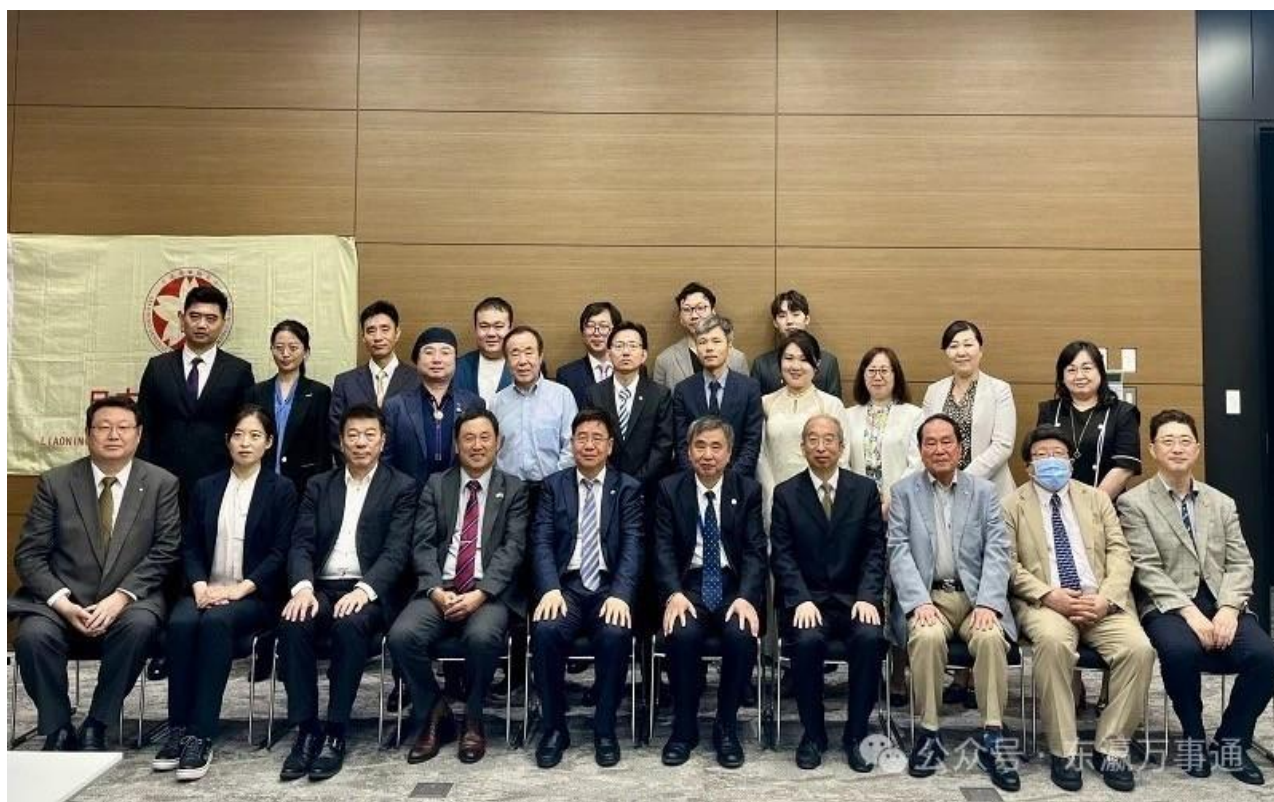
2024年6月1日“辽宁省人大民族委员会日韩访问团交流座谈会”