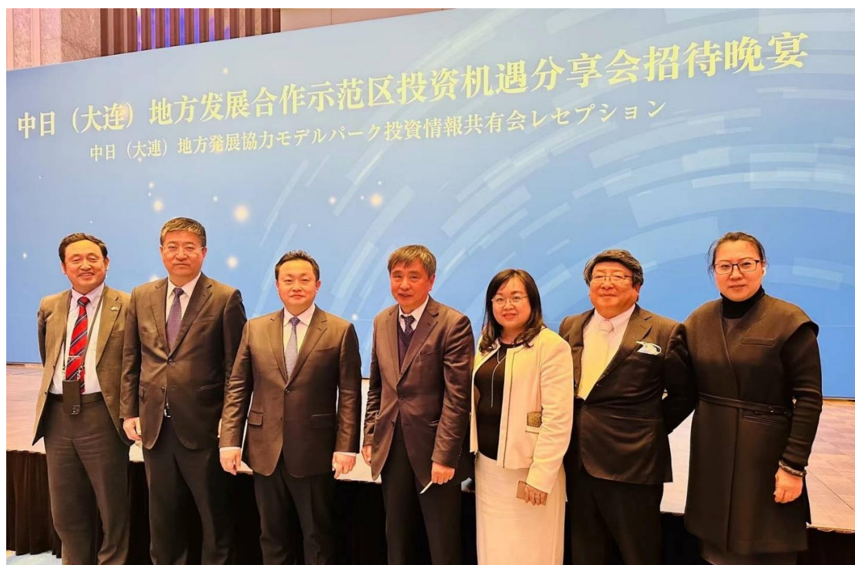
2024年2月25日“日本东京大连周”