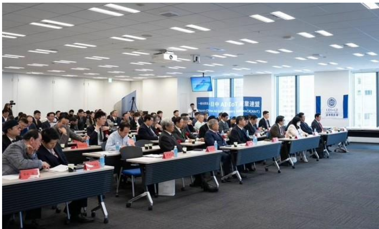
2024 年 2 月 16 日 “首届国际 M&A 高峰论坛”