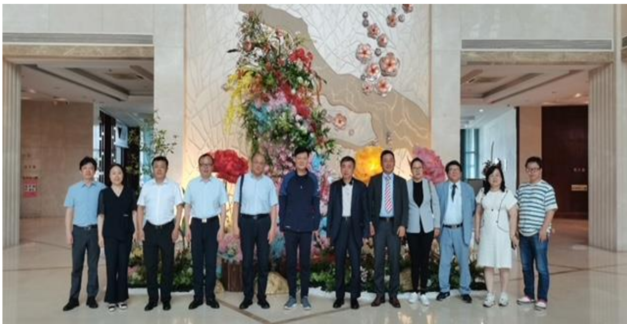
2024年7月29日“日本辽宁总商会辽宁出访团拜会铁岭市委员领导”