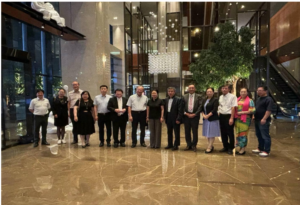
2024年7月29日“日本辽宁总商会辽宁出访团拜会辽宁省商务厅领导”